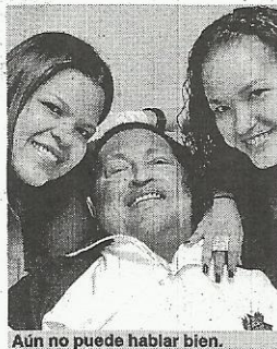
Aún no puede hablar bien.

• Según el Ministerio de Sanidad, dos personas se encuentran en estado grave y otras de mediana gravedad debido a diversos traumas. Pese a que los expertos aseguran que los fragmentos del meteorito no son radiactivos, el Ministerio para Emergencias aconsejó a la población que no se acerque a la zona del impacto.