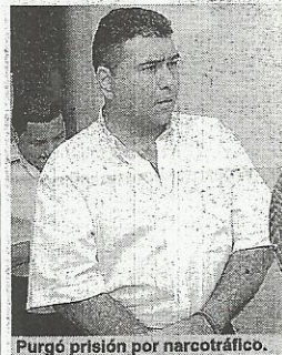
Purgó prisión por narcotráfico.

El ministro de Ciencia y yerno de Chávez, Jorge Arreaza, dijo que Chávez sigue presentando un cierto grado de insuficiencia respiratoria, y por ello se le ha colocado una cánula traqueal que le dificulta temporalmente el habla.